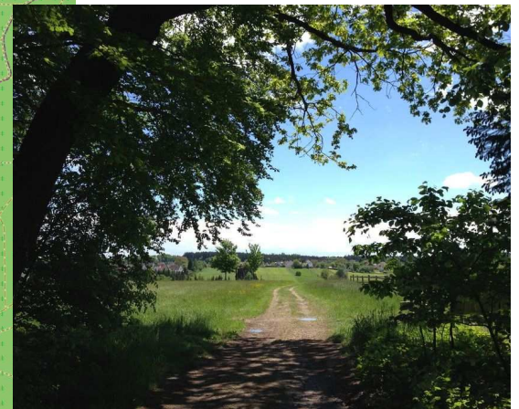
Blick durchs „Straßberger Tor“